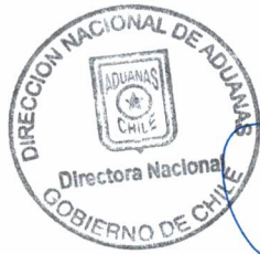
Alejandra Arriaza Loeb Directora Nacional de Aduanas

ANÓTESE, COMUNÍQUESE Y PUBLÍQUESE EN EXTRACTO EN EL DIARIO OFICIAL E ÍNTEGRAMENTE EN LA PÁGINA WEB DEL SERVICIO NACIONAL DE ADUANAS.